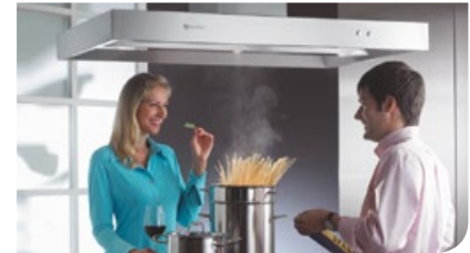
Zehnder ComfoHood Inselhaube

Zehnder ComfoHood ist ein einzigartiges, leistungsstarkes, nahezu geräuschloses und hygienisches Küchenabluftsystem.